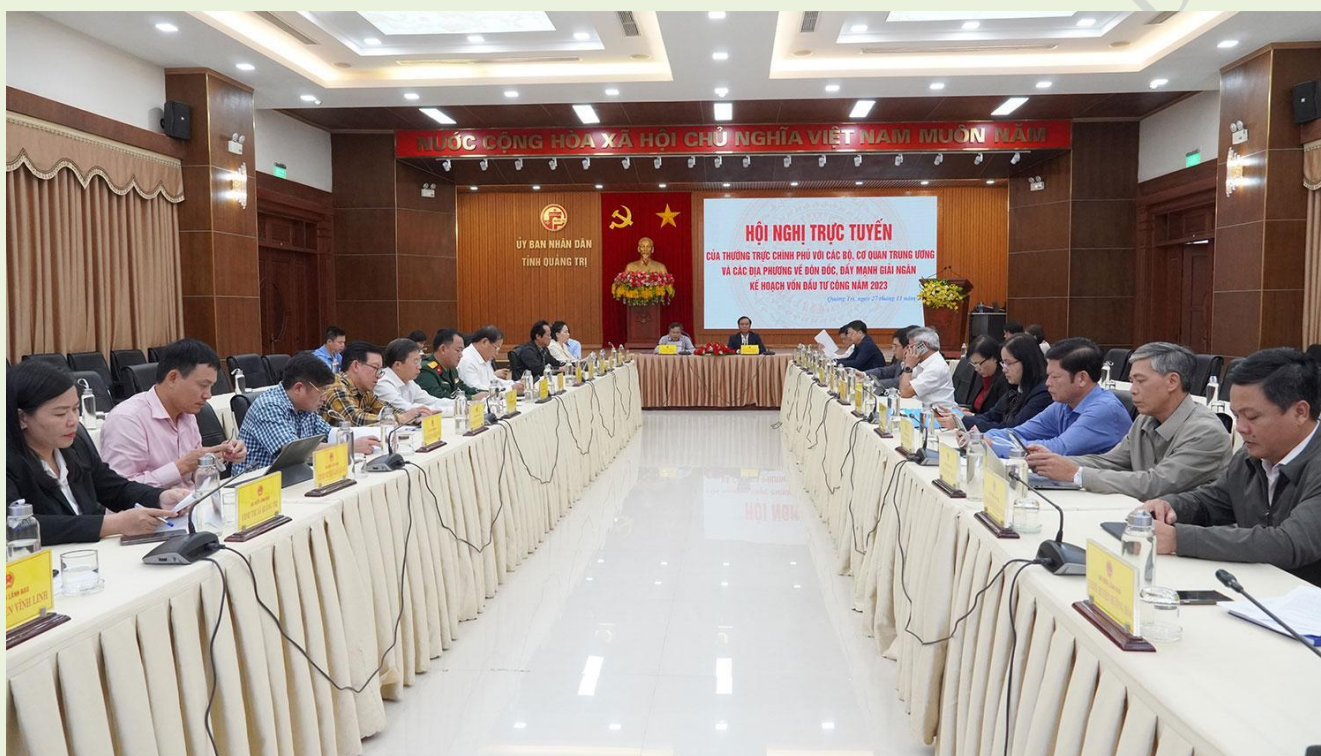
Toàn cảnh hội nghị tại điểm cầu tỉnh Quảng Trị