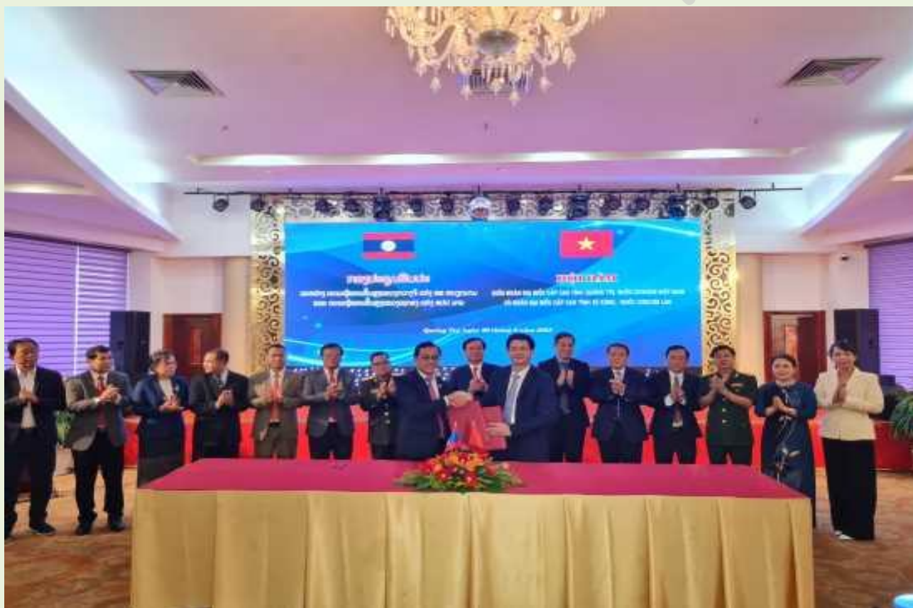
Lãnh đạo cấp cao hai tỉnh ký kết biên bản hội đàm.