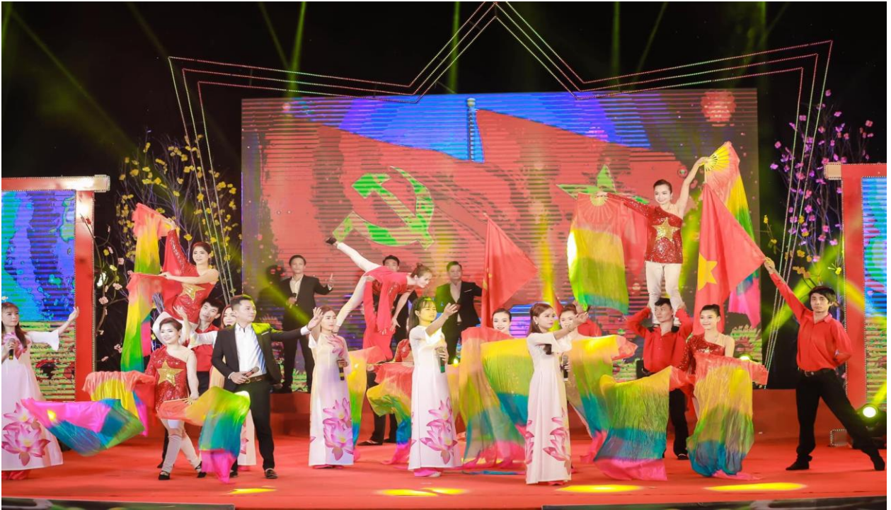
Một tiết mục nghệ thuật trong chương trình

Những năm trước, Chương trình nghệ thuật đặc biệt mừng Đảng, mừng xuân diễn ra tại Trung tâm Văn hóa - Điện ảnh tỉnh. Tuy nhiên, do tình hình COVID-19 diễn biến phức tạp và đảm bảo thực hiện các quy định về phòng, chống dịch bệnh nên Chương trình nghệ thuật đặc biệt mừng Đảng, mừng xuân Nhâm Dần - 2022 được Đài PT - TH Quảng Trị phối hợp với Sở Văn hóa, Thể thao & Du lịch, một số ca sĩ con em người Quảng Trị, Vũ đoàn The Queen, Bước Việt... tổ chức, được ghi hình vào cuối tháng 1/2022 và phát trên sóng Đài PT - TH Quảng Trị vào lúc 0 giờ 20 phút ngày 1/2, nhằm ngày mùng 1 Tết Nguyên đán Nhâm Dần - 2022 và những khung giờ khác.