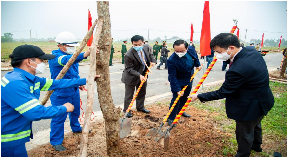
Lãnh đạo tỉnh trồng cây tại Lễ phát động Tết trồng cây “Đời đời nhớ ơn Bác Hồ” xuân Nhâm Dần - 2022