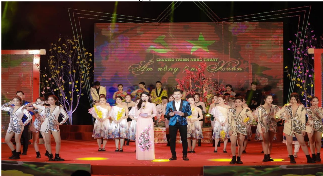
Chương trình nghệ thuật đặc biệt mừng Đảng, mừng Xuân Nhâm Dần 2022 - Ảnh: BTC