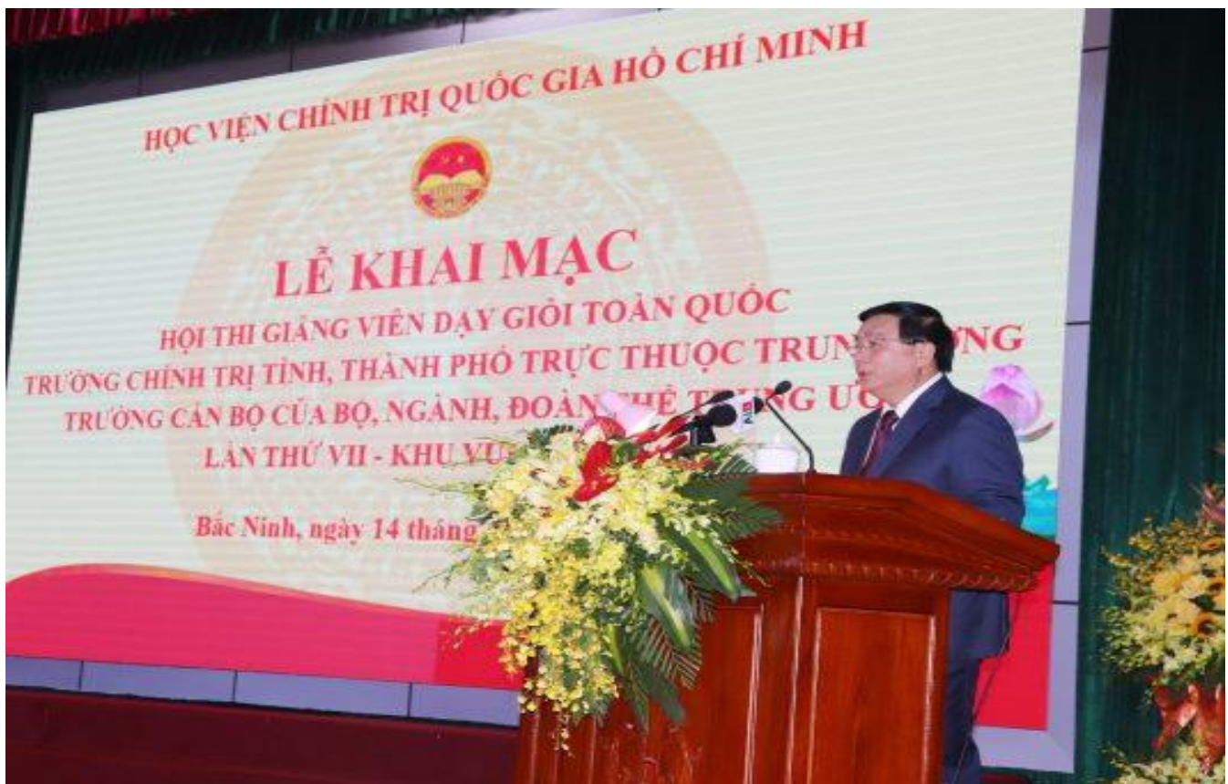
Giám đốc Học viện Chính trị Quốc gia Hồ Chí Minh Nguyễn Xuân Thắng phát biểu tại Lễ khai mạc Hội thi

Phát biểu tại Lễ khai mạc Hội thi, Giám đốc Học viện Chính trị Quốc gia Hồ Chí Minh Nguyễn Xuân Thắng nhấn mạnh mục đích, ý nghĩa của Hội thi, khẳng định việc tổ chức Hội thi là cơ sở quan trọng để Học viện Chính trị Quốc gia Hồ Chí Minh nắm bắt cụ thể hơn nhu cầu và tình hình đào tạo, bồi dưỡng cán bộ, đội ngũ giảng viên của các trường; nghiên cứu, rút kinh nghiệm, xây dựng, hướng dẫn, thống nhất quản lý và đổi mới nội dung chương trình, giáo trình, phương pháp giảng dạy, học tập; bổ sung quy chế, đào tạo, bồi dưỡng giảng viên..., góp phần thực hiện tốt hơn, hiệu quả hơn, sát thực hơn nhiệm vụ hướng dẫn, chỉ đạo chuyên môn; đào tạo, bồi dưỡng giảng viên cho các trường chính trị, các trường bộ ngành. Đề nghị Ban Tổ chức, Ban Giám khảo Hội thi phát huy tinh thần trách nhiệm, bảo đảm Hội thi an toàn, khách quan, chính xác, đúng tiến độ và thời gian quy định. Các thí sinh nên coi đây là cơ hội phát huy cao nhất khả năng, kinh nghiệm chuyên môn của mình thực hiện tốt nội dung bài giảng trong Hội thi, thực hiện đầy đủ, nghiêm túc những quy định và kế hoạch của Hội thi.