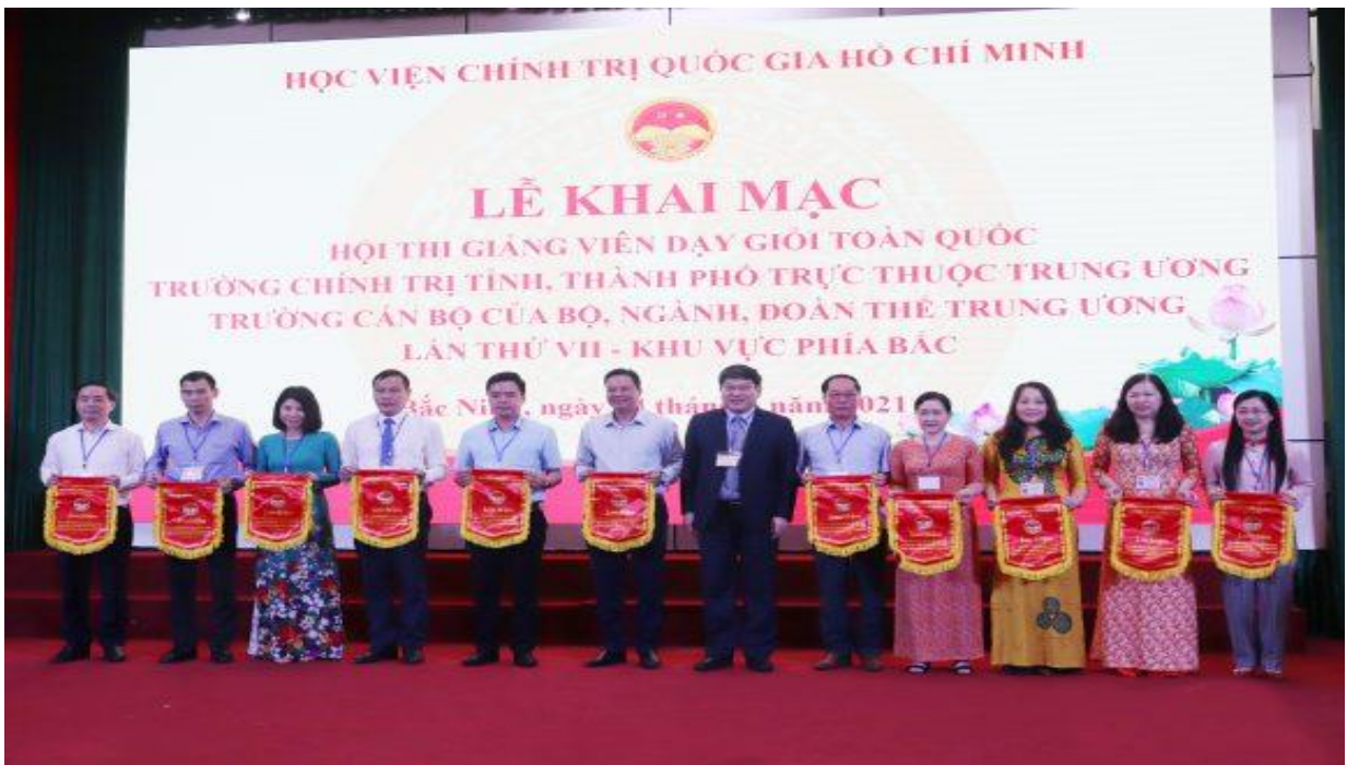
Ban tổ chức Hội thi trao cờ lưu niệm cho các đơn vị tham gia Hội thi

Để Hội thi đạt kết quả tốt, Giám đốc Học viện Chính trị quốc gia Hồ Chí Minh đề nghị những thí sinh của Hội thi thể hiện tài năng, phát huy khả năng, kinh nghiệm chuyên môn của mình để thực hiện tốt nội dung bài giảng, thực hiện đầy đủ, nghiêm túc những quy định và kế hoạch của Hội thi. Bên cạnh đó, các đồng chí trong Hội đồng Giám khảo hội thi cần phát huy tinh thần trách nhiệm, tổ chức tốt việc chấm thi, bảo đảm đánh giá theo đúng Quy chế Hội thi.