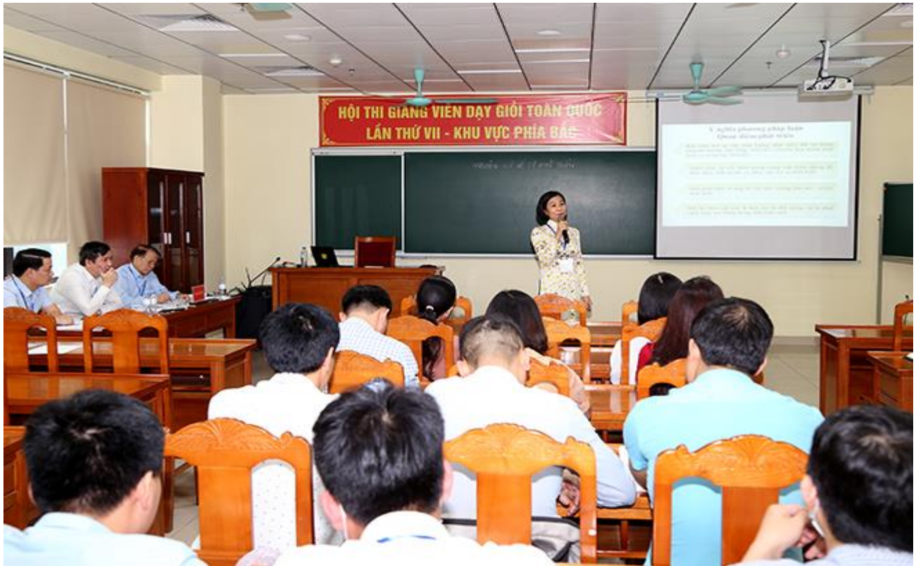
Thí sinh tham dự phần thi giảng với lớp học giả định theo quy định của Ban Tổ chức