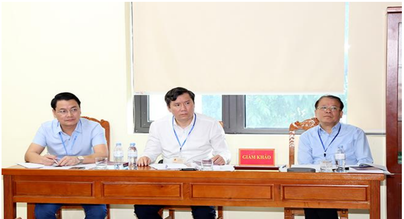
Hội đồng giám khảo được thành lập theo từng chuyên ngành