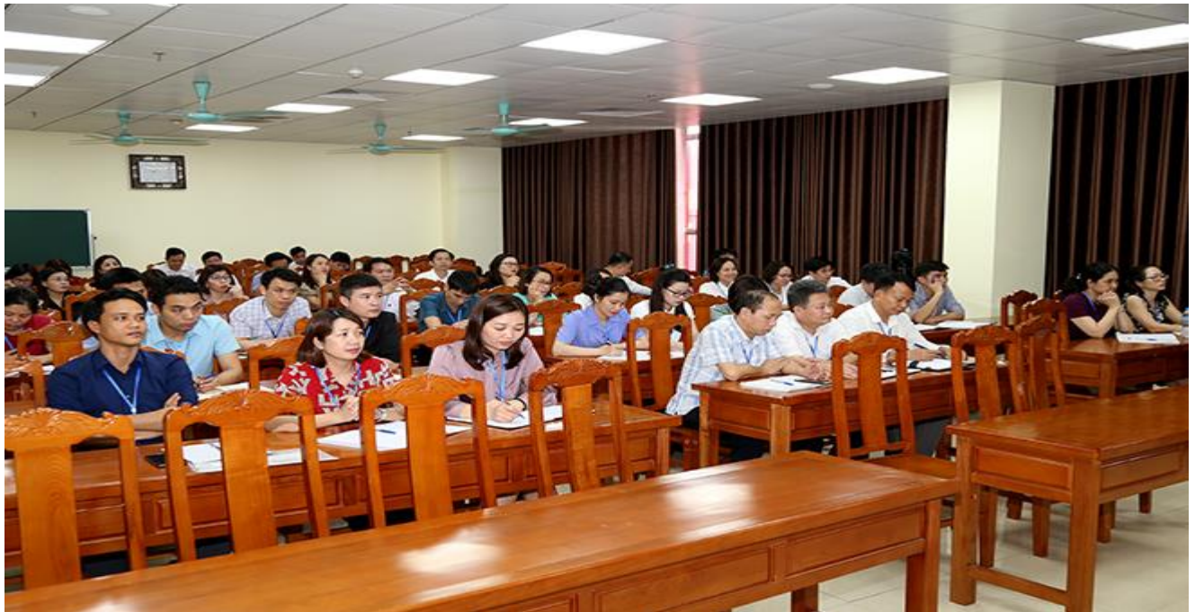
Lớp học giả định được thành lập theo quy định của Ban Tổ chức để đảm bảo các yêu cầu, điều kiện giúp thí sinh hoàn thành tốt phần thi