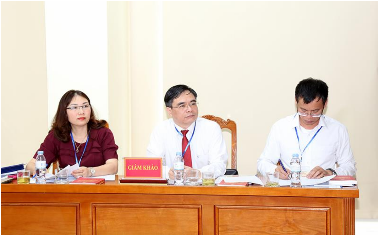
Hội đồng giám khảo được thành lập theo từng chuyên ngành