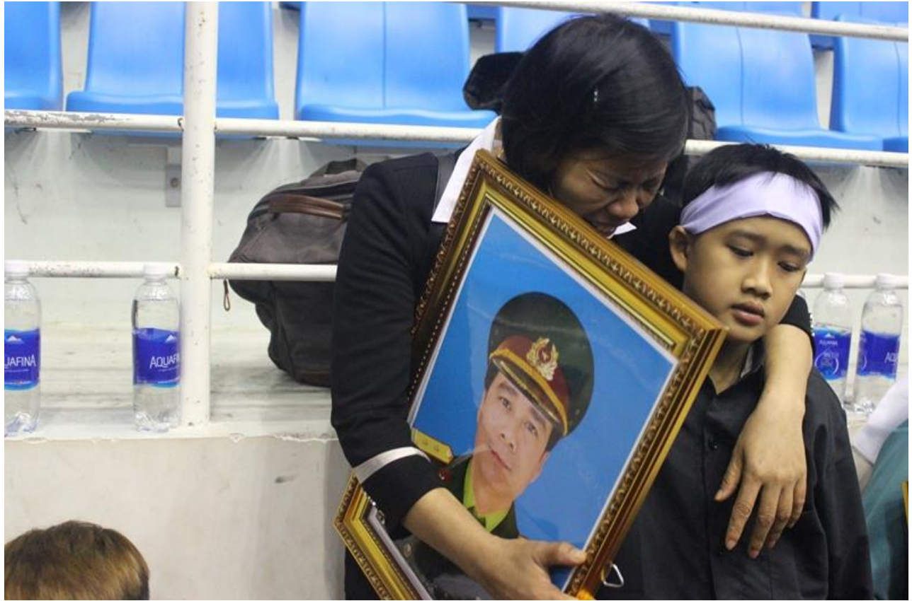
Hình ảnh thân nhân của các liệt sĩ có mặt tại Lễ viếng và truy điệu.