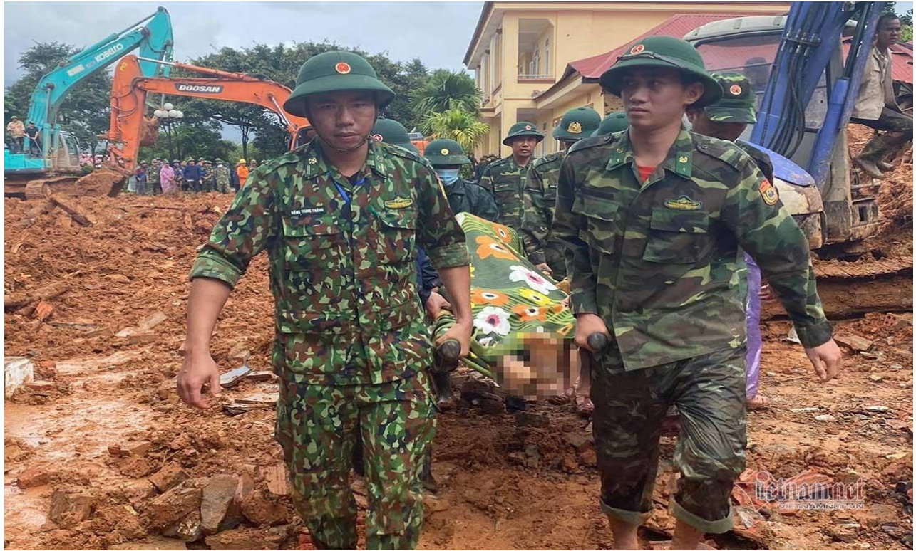
Khiêng thi thể các đồng đội đi ra ngoài. Danh sách tìm thấy ngày càng nổi dài thêm