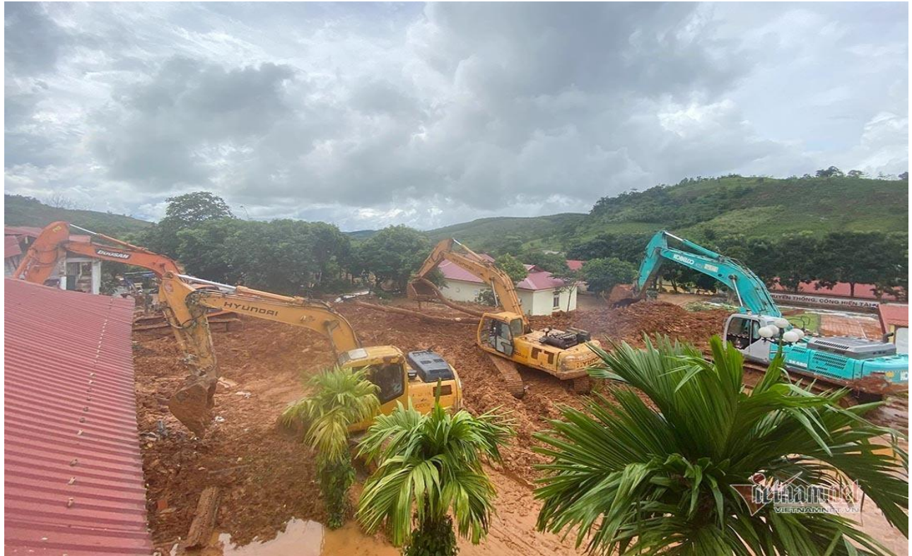
Máy xúc được huy động vào hiện trường tìm kiếm cứu nạn