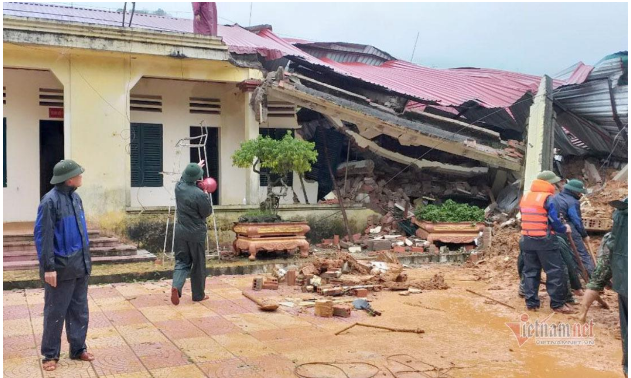
Trong đống đổ nát, các đồng đội của 22 cán bộ chiến sỹ đang cố gắng lật từng viên gạch, cục đất để tìm kiếm các nạn nhân