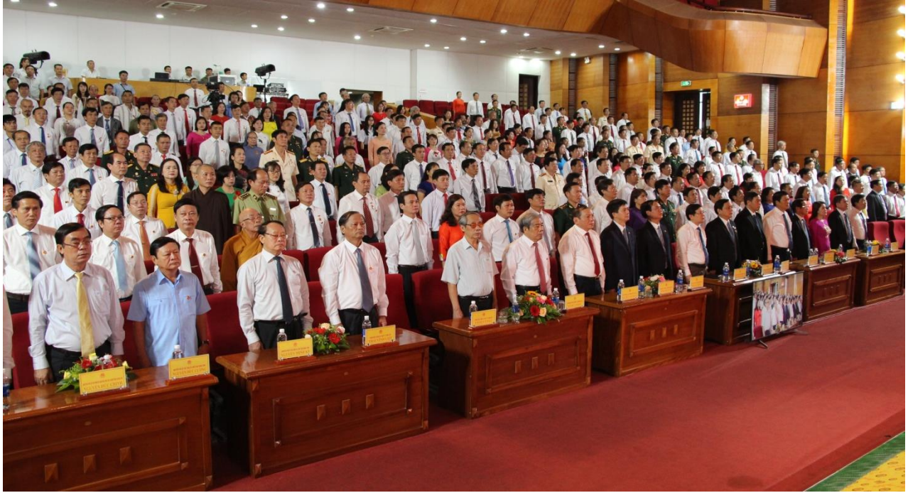
Các đại biểu dự Đại hội Thi đua yêu nước tỉnh Quảng Trị lần thứ V, giai đoạn 2020-2025