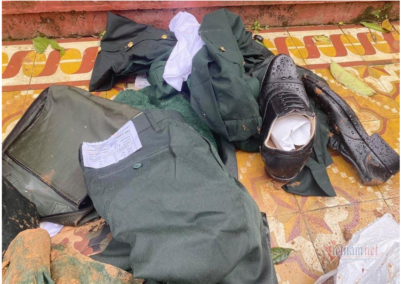
Đồ tư trang quân phục của các cán bộ, chiến sỹ mới cấp phát chưa một lần mặc