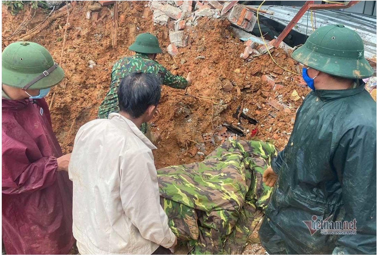
Nhớ lòng khi chạm gần thi thể đồng đội lạnh buốt