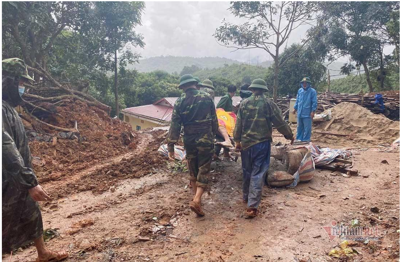
Gần một ngày tìm kiếm các đồng đội, ai cũng lấm lem bùn đất hoà quyện trong cơn mưa chiều