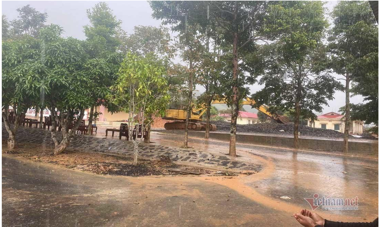
Con mưa chiều nặng hạt ở hiện trường đã khiến công tác tìm kiếm các nạn nhân còn lại gặp khó khăn