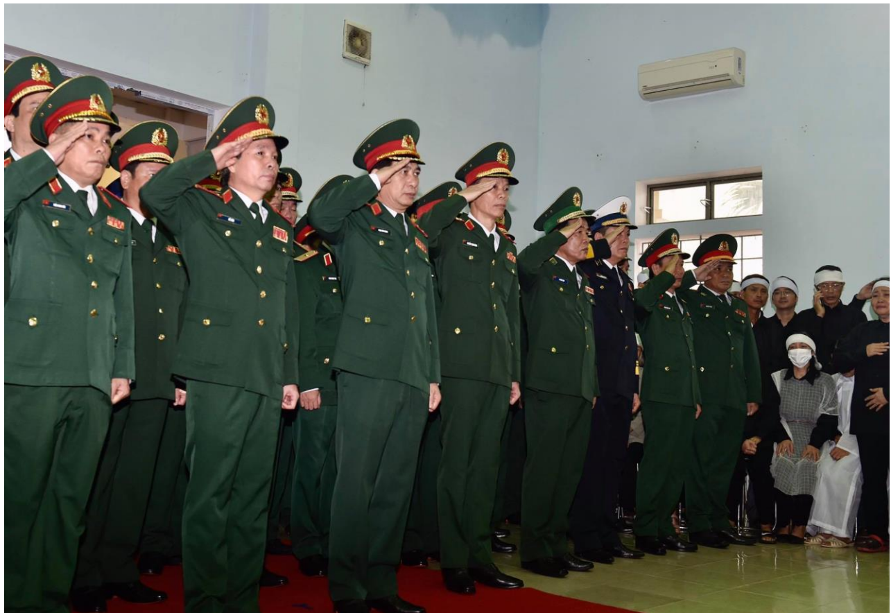
Đoàn Quân ủy Trung ương, Bộ Quốc phòng