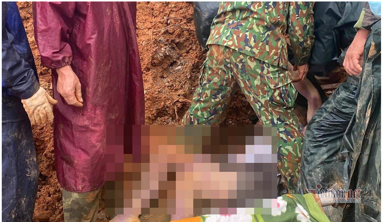
Mỗi lúc tìm thấy thi thể đồng đội trong đống đổ nát, các anh nhẹ tay để đưa lên cáng rồi khiêng ra ngoài. Không một ai cảm được lòng khi thấy cảnh đau đớn này