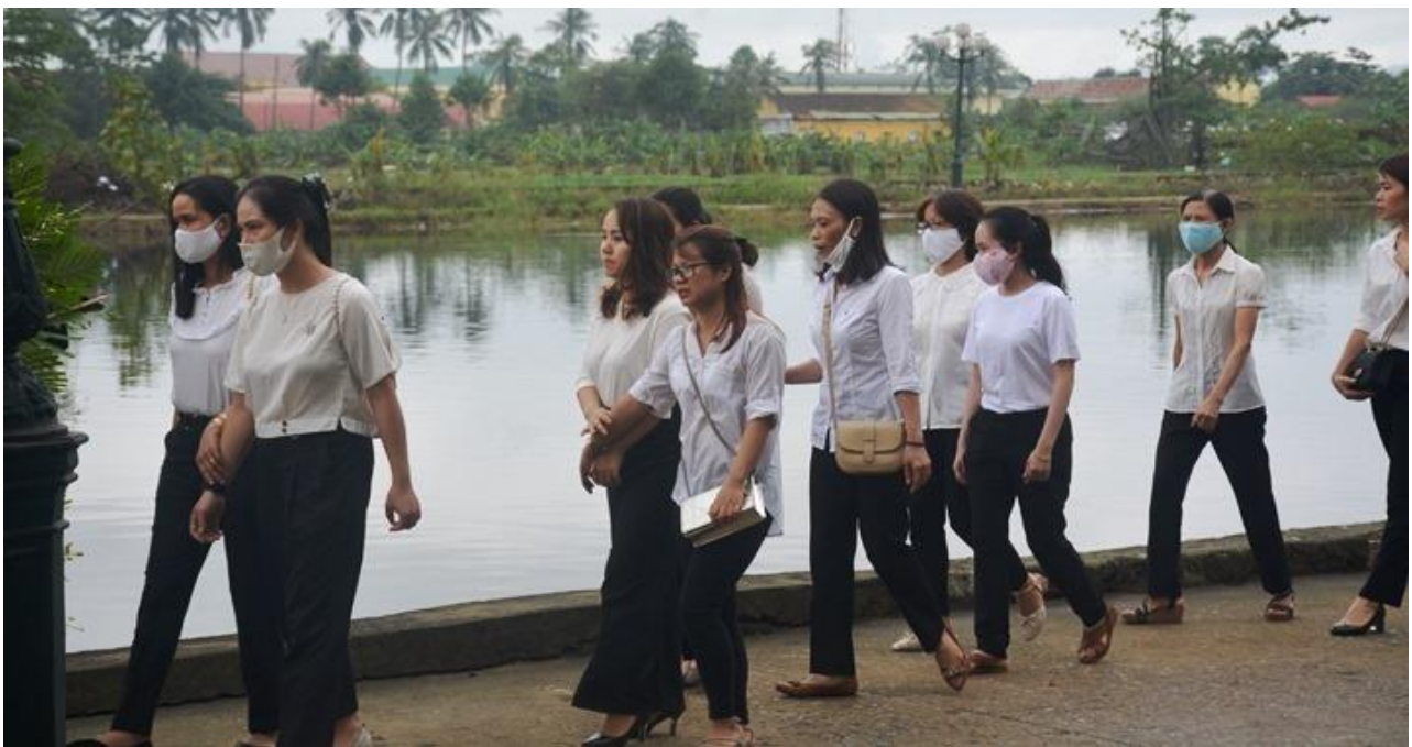
Người dân xếp hàng chờ vào thắp hương cho 13 cán bộ, chiến sĩ

11h trưa nay, UBND tỉnh Thừa Thiên - Huế và Bộ Quốc phòng tổ chức lễ truy điệu 13 cán bộ, chiến sĩ hy sinh khi cứu hộ thủy điện Rào Trăng 3.