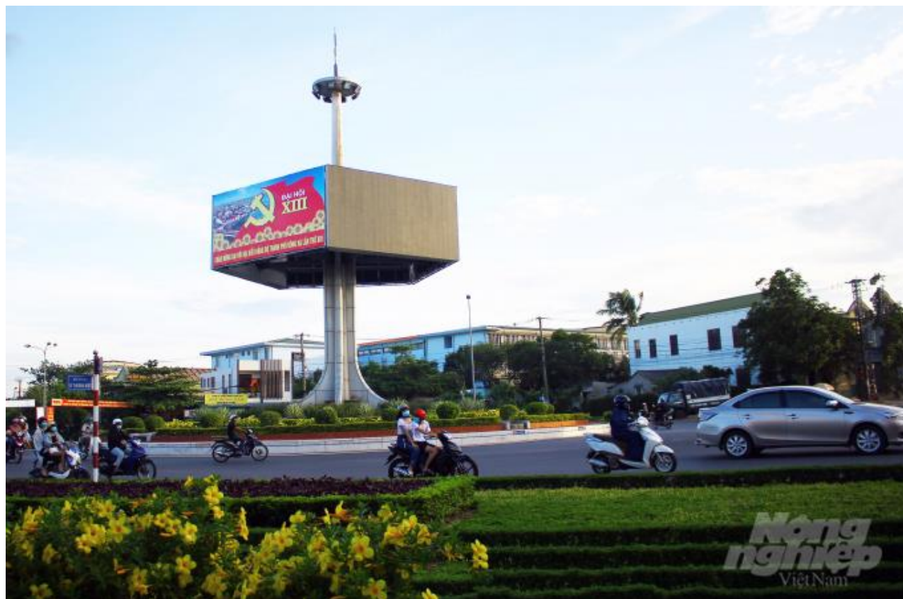
Đại hội Đảng bộ tỉnh Quảng Trị diễn ra từ ngày 14 - 17/10.

Theo đó, chủ đề Đại hội Đảng bộ tỉnh Quảng Trị lần thứ XVII dự kiến là “Tăng cường xây dựng Đảng và hệ thống chính trị trong sạch, vững mạnh; phát huy dân chủ và sức mạnh đại đoàn kết toàn dân, khát vọng phát triển, đổi mới sáng tạo; huy động và sử dụng hiệu quả mọi nguồn lực, đẩy mạnh phát triển kinh tế - xã hội; giữ vững quốc phòng - an ninh; phấn đấu đưa Quảng Trị trở thành tỉnh có trình độ phát triển thuộc nhóm trung bình cao của cả nước”.