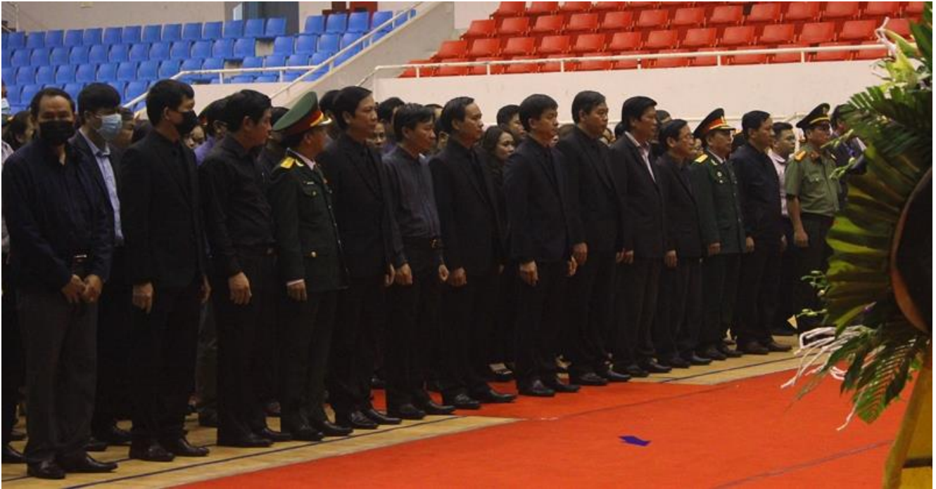
Đoàn đại biểu Tỉnh ủy, HĐND, UBND, Ủy ban MTTQ tỉnh Quảng Trị viếng cán bộ, chiến sĩ Đoàn Kinh tế - Quốc phòng 337 hy sinh

Ngày 20/10, Tổng Bí thư, Chủ tịch nước Nguyễn Phú Trọng đã ký Quyết định truy tặng Huân chương Bảo vệ Tổ quốc (5 Huân chương hạng Nhì và 17 Huân chương hạng Ba) cho 22 cán bộ, chiến sĩ Đoàn Kinh tế - Quốc phòng 337, Quân khu 4, hy sinh trong thực hiện nhiệm vụ phòng, chống, khắc phục hậu quả thiên tai.