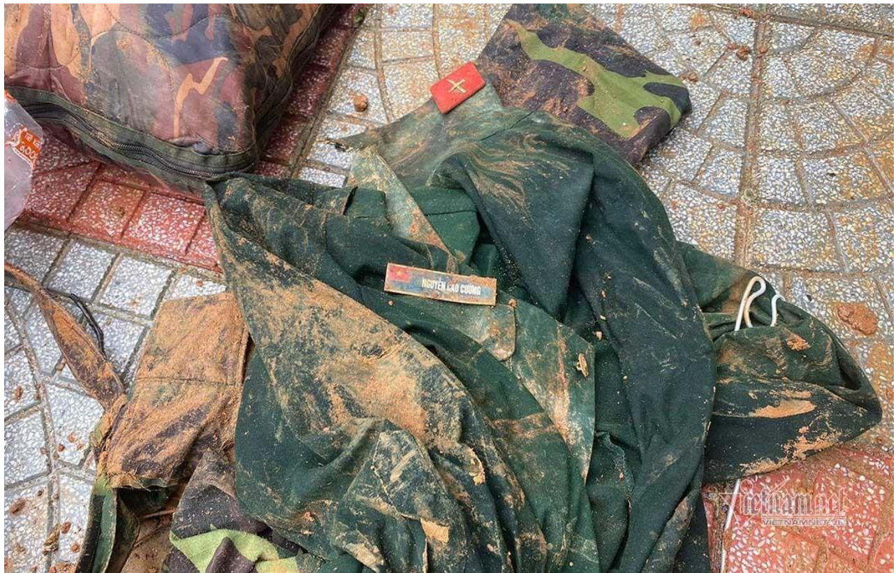
Tất cả đều lấm lem bùn đất khi bới từ đống đổ nát