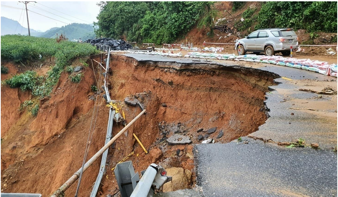
Điểm sạt lở đất ở Km5 đường Hồ Chí Minh gây mất an toàn giao thông nghiêm trọng