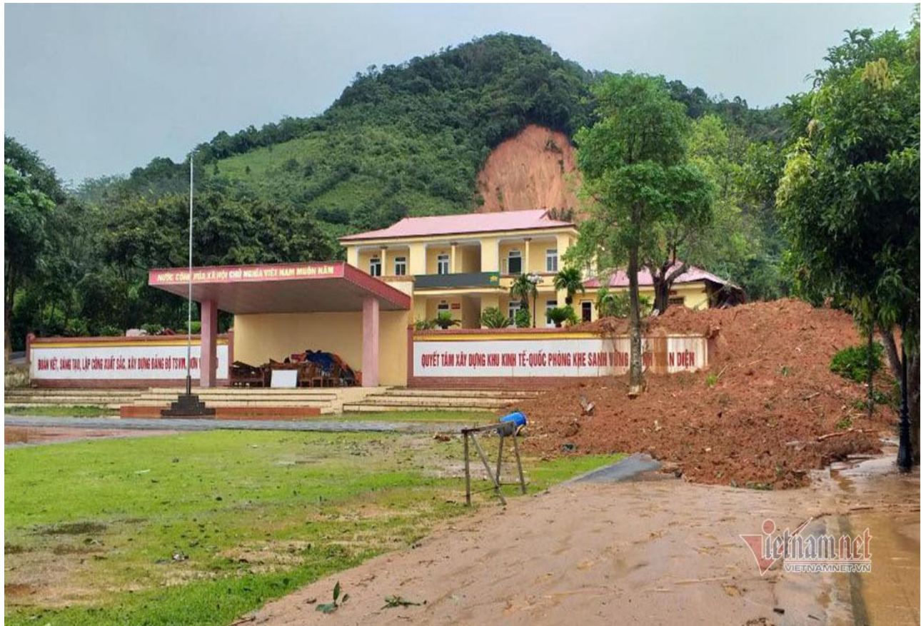
Phía trước thao trường, đất đá trào ra phía trước sau vụ sạt lở kinh hoàng