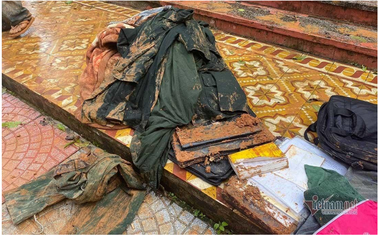
Cặp sách, sổ sách và tài liệu của các cán bộ chiến sỹ bị vùi trong đống đổ nát