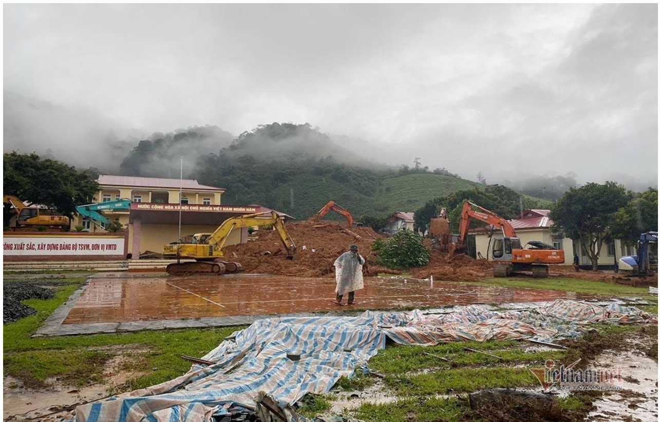
Bầu trời nơi hiện trường tìm kiếm lúc 16h như muốn đổ sập xuống, trời đang mưa dần nặng hạt