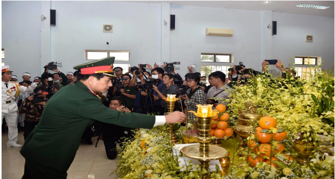
Thượng tướng Phan Văn Giang viếng các liệt sĩ