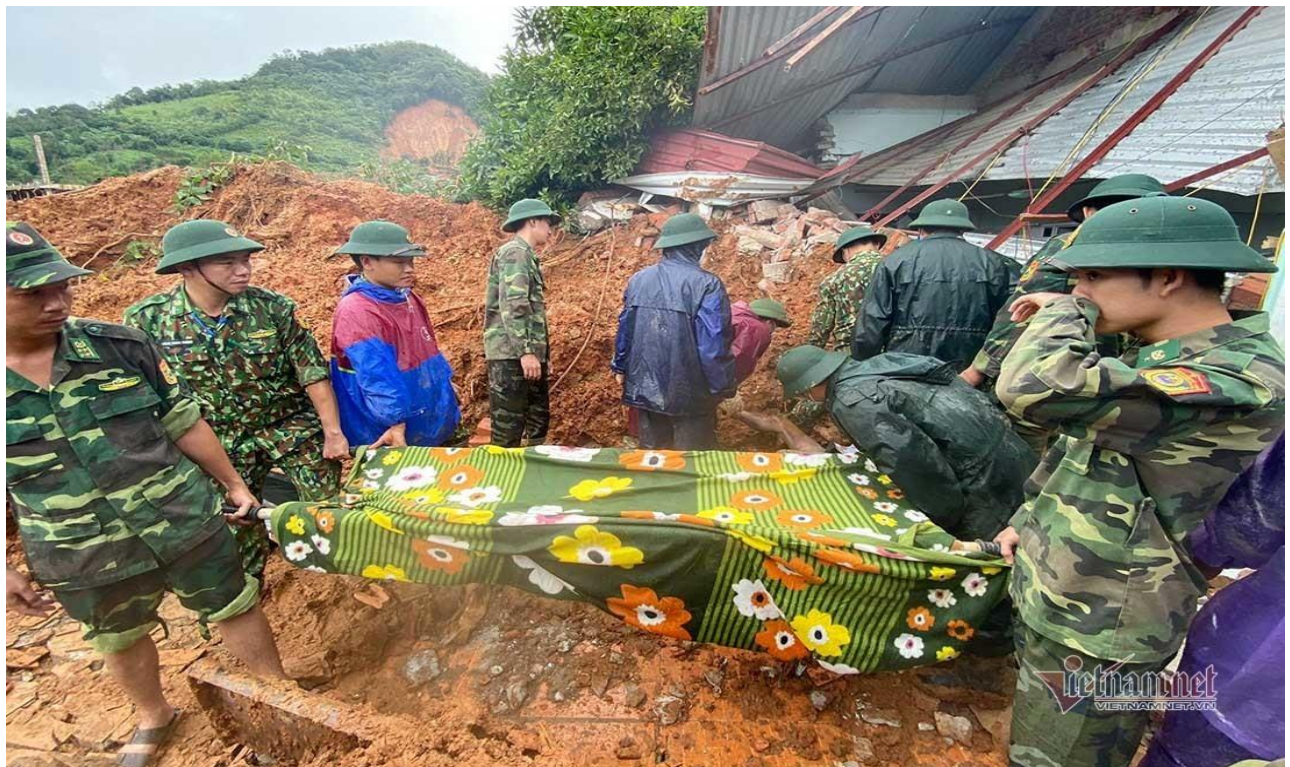
Đưa thi thể đồng đội lên cồng rồi đắp chiếc chăn mỏng khiêng ra ngoài lúc trời mưa rả rích