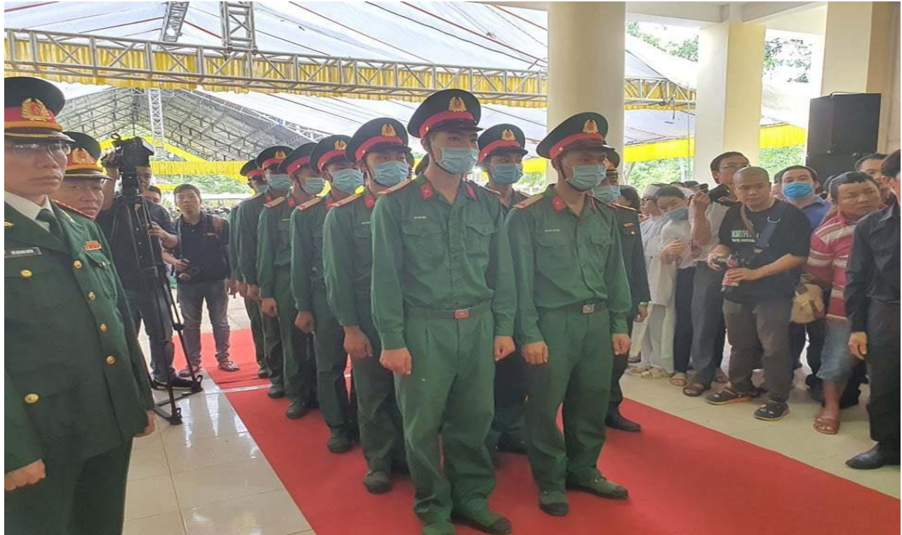
11h20, Ban tổ chức tang lễ tiên hành lễ di quan các liệt sĩ.