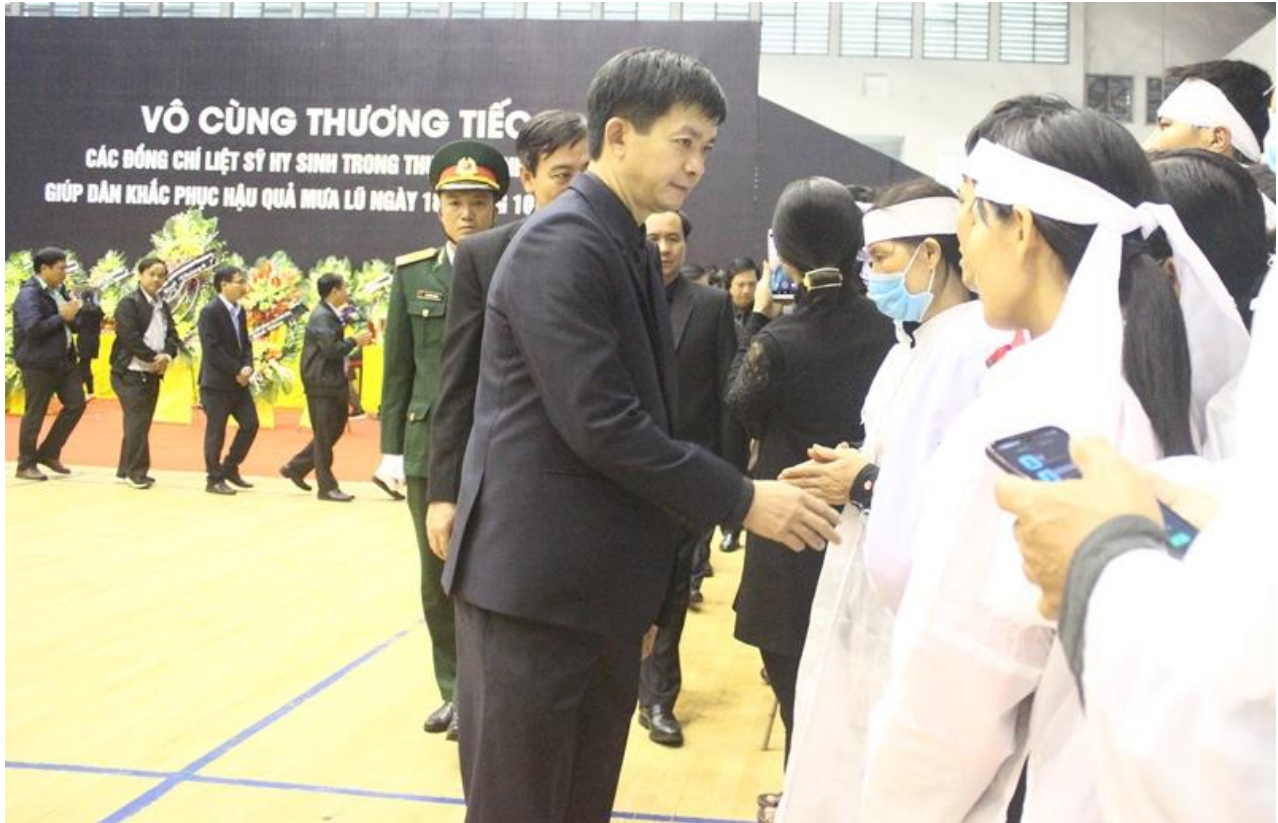
Bí thư Tỉnh ủy Lê Quang Tùng động viên các thân nhân liệt sĩ

Trước đó, vào khoảng 1 giờ ngày 18/10, tại thôn Cọp, xã Hướng Phùng, huyện Hướng Hóa, Quảng Trị xảy ra vụ sạt lở đất đặc biệt nghiêm trọng khiến 22 cán bộ, chiến sĩ của Đoàn Kinh tế Quốc phòng 337 thuộc Quân khu 4 bị vùi lấp. Ngay sau khi vụ việc xảy ra, các đơn vị của Bộ Quốc phòng và tỉnh Quảng Trị đã huy động tối đa lực lượng, phương tiện để tìm kiếm những cán bộ, chiến sĩ bị vùi lấp với tinh thần khẩn trương, quyết liệt để tìm được các nạn nhân trong thời gian sớm nhất.