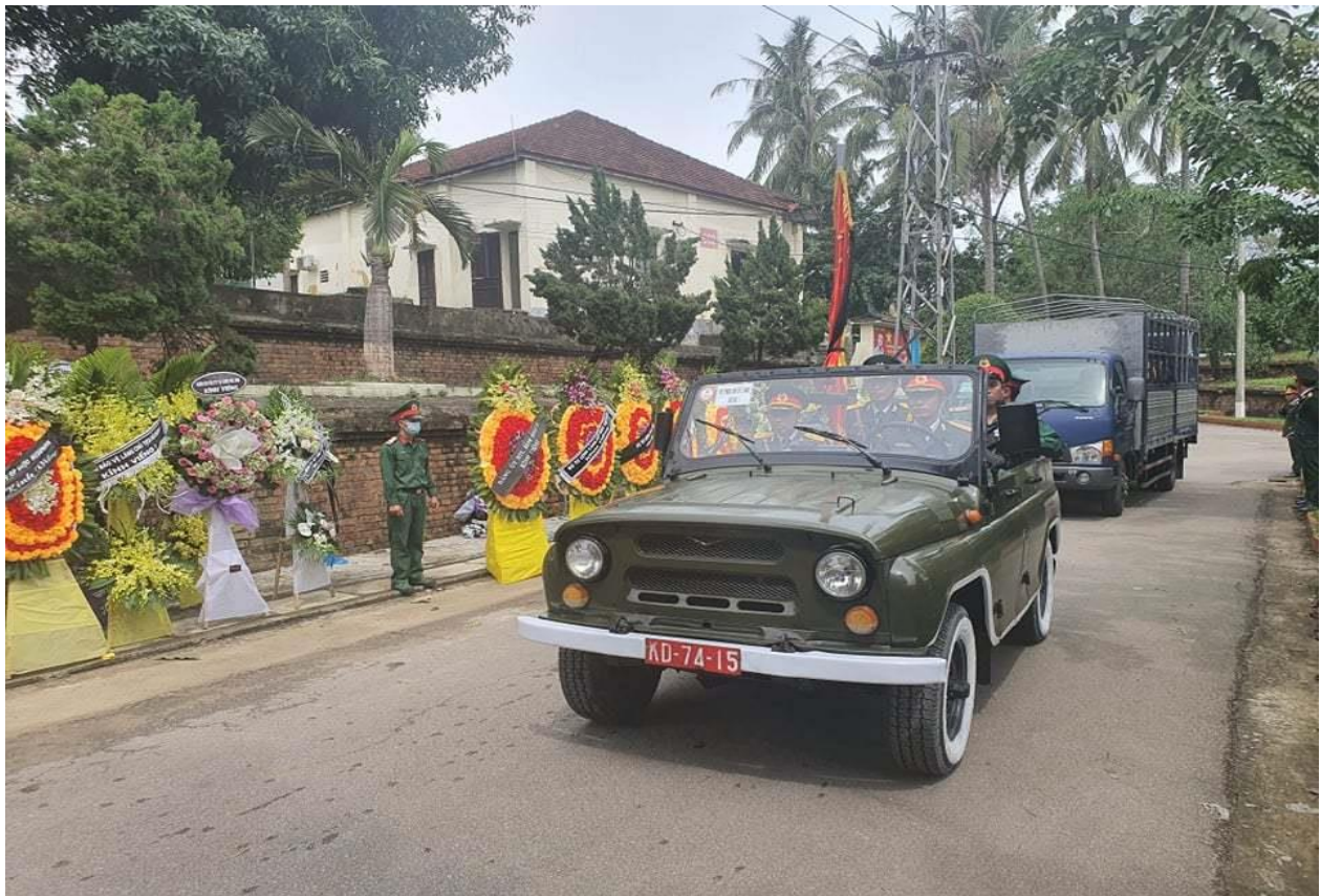
Nghện ngào tiễn đưa 13 cán bộ, chiến sĩ hy sinh ở Rào Trăng 3