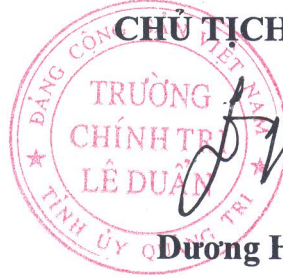
Dương Hương Sơn