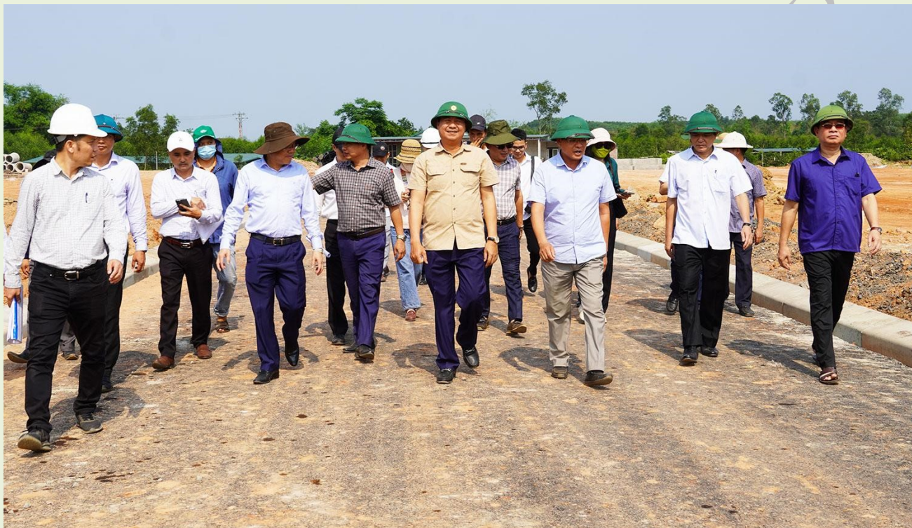
Toàn cảnh hội thảo

Tiếp tục chương trình xúc tiến đầu tư tại Hàn Quốc, sáng nay 26/4, tại Thủ đô Seoul, UBND tỉnh Quảng Trị phối hợp Đại sứ quán Việt Nam tại Hàn Quốc, Hiệp hội các doanh nghiệp vừa và nhỏ Hàn Quốc (KBIZ) tổ chức Hội thảo Xúc tiến đầu tư tỉnh Quảng Trị năm 2024